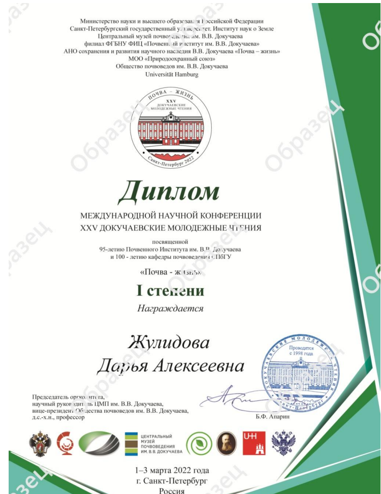
Образец Диплома 1 степени