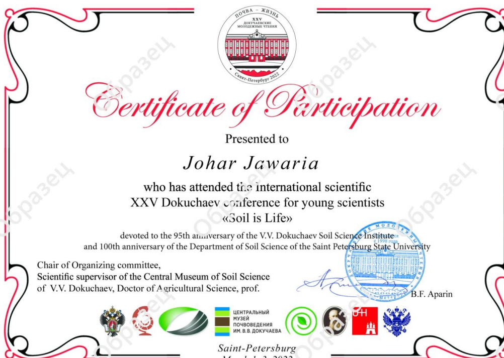
Образец Сертификата участника на английском языке