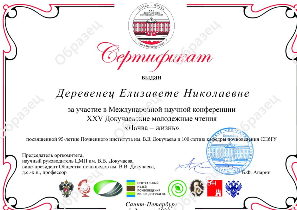
Образец Сертификата участника на русском языке