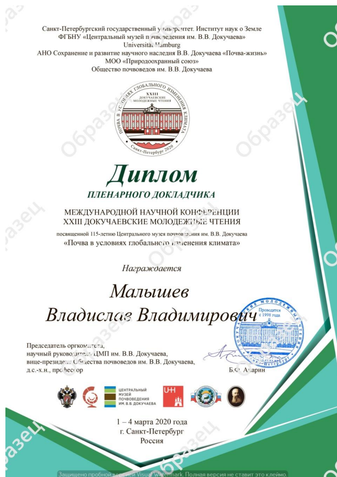
Образец Диплома пленарного докладчика